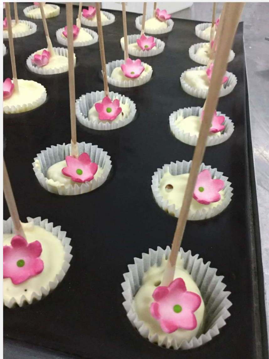
Cake pop – ciasto na patyku