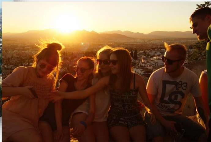
Zachód słońca na San Miguel Alto