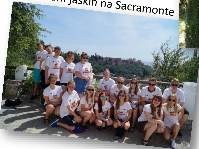
W muzeum jaskiń na Sacramonte