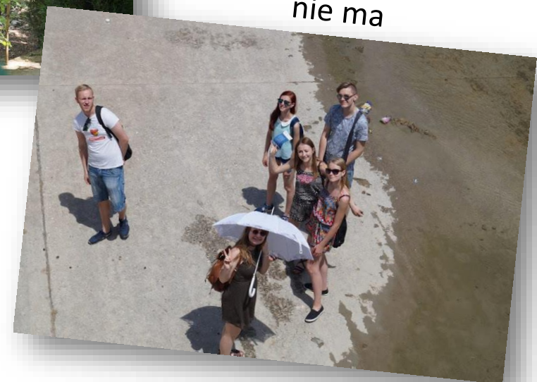
Nad rzeką, której prawie nie ma