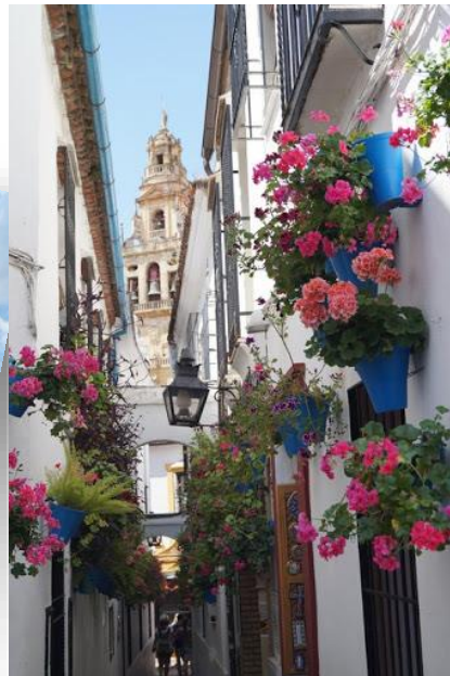
Calle del Flores