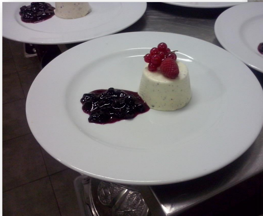
Parfait de stracciatela