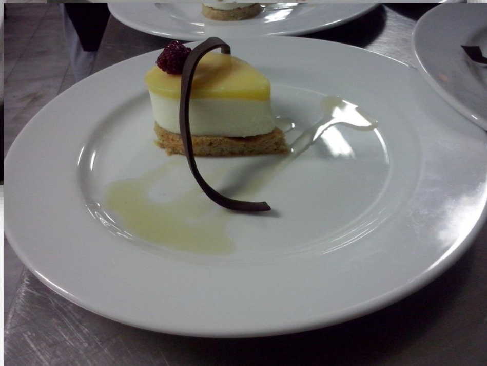
Tarta de yogur y limón – tarta jogurtowa z cytryną