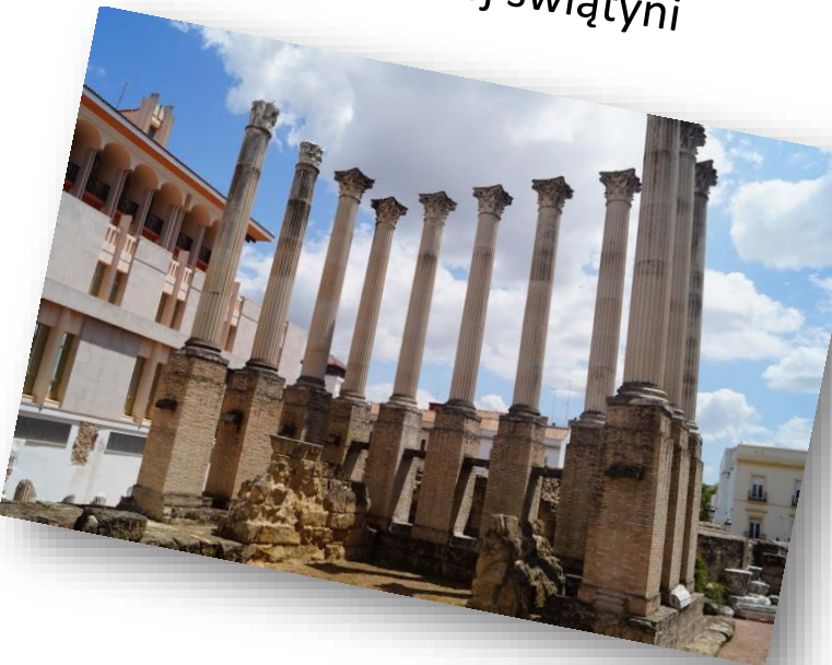
Fragment rzymskiej świątyni