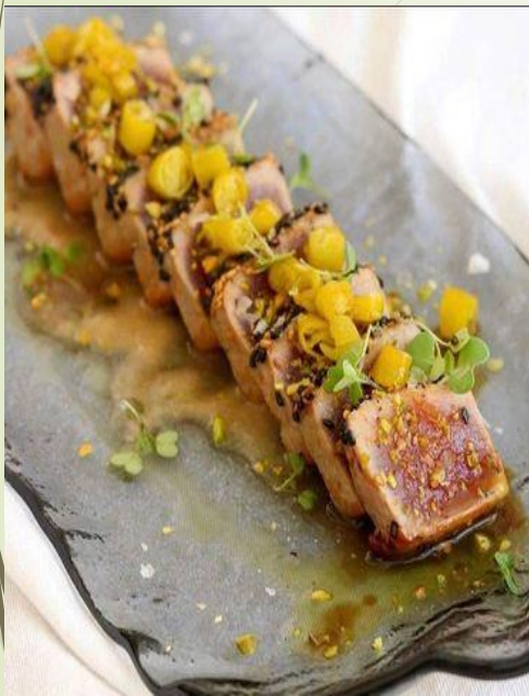
Tataki de atun