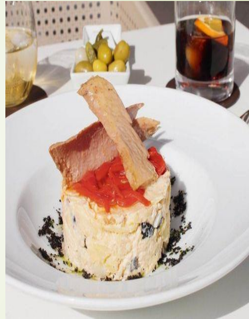
Ensaladilla de patata