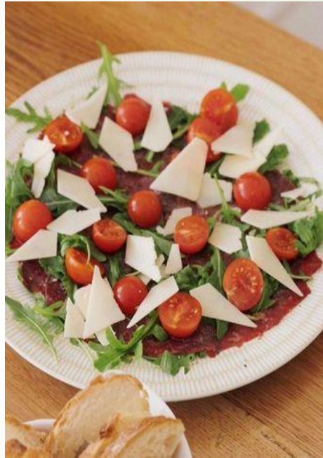
Carpaccio de terne