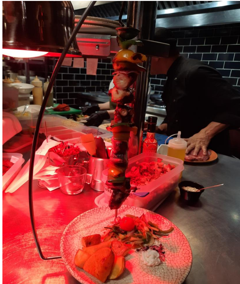
Brocheta de pulpo