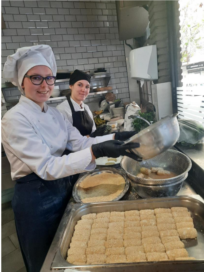
Croqueta de pollo