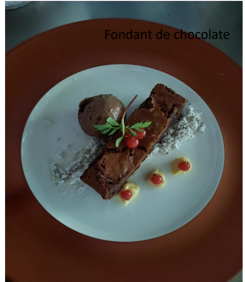
Fondant de chocolate