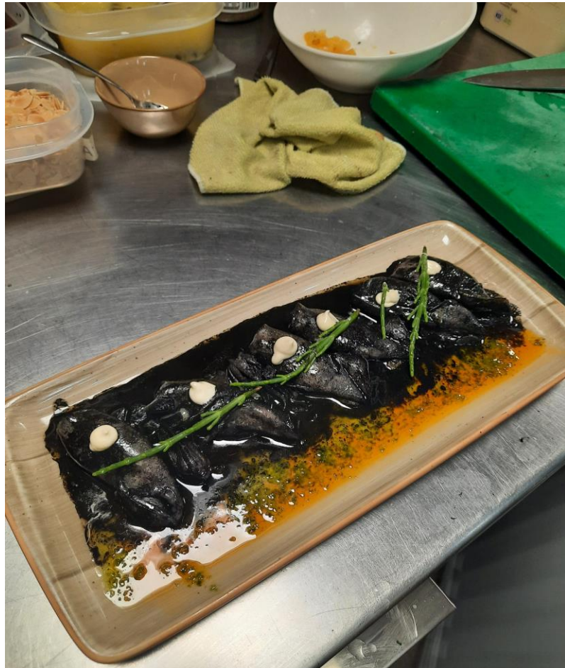
Chipirones salteados en su tinta